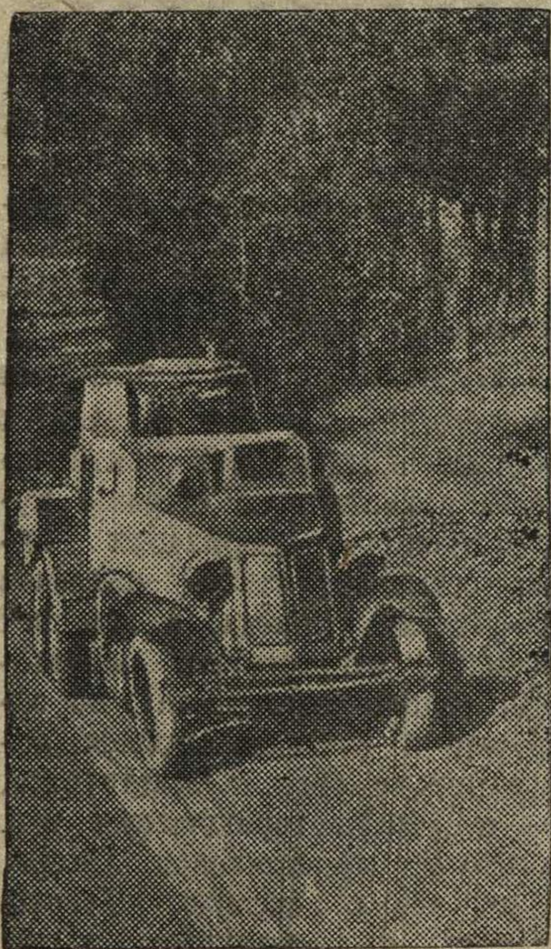
Бронемашины в походе.