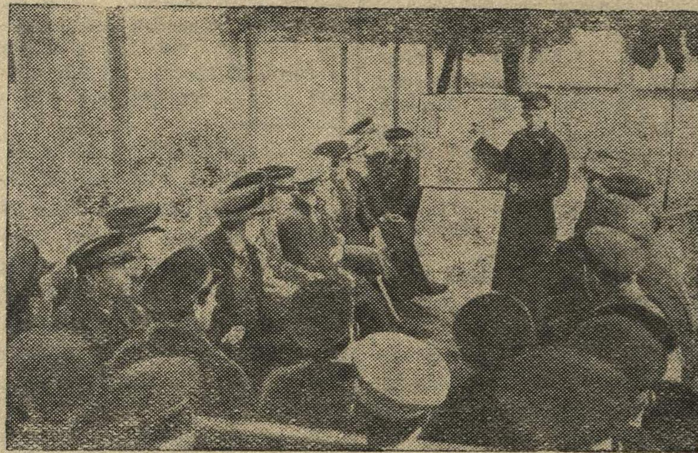
Работники 1 горотделения изучают материальную часть гранаты.