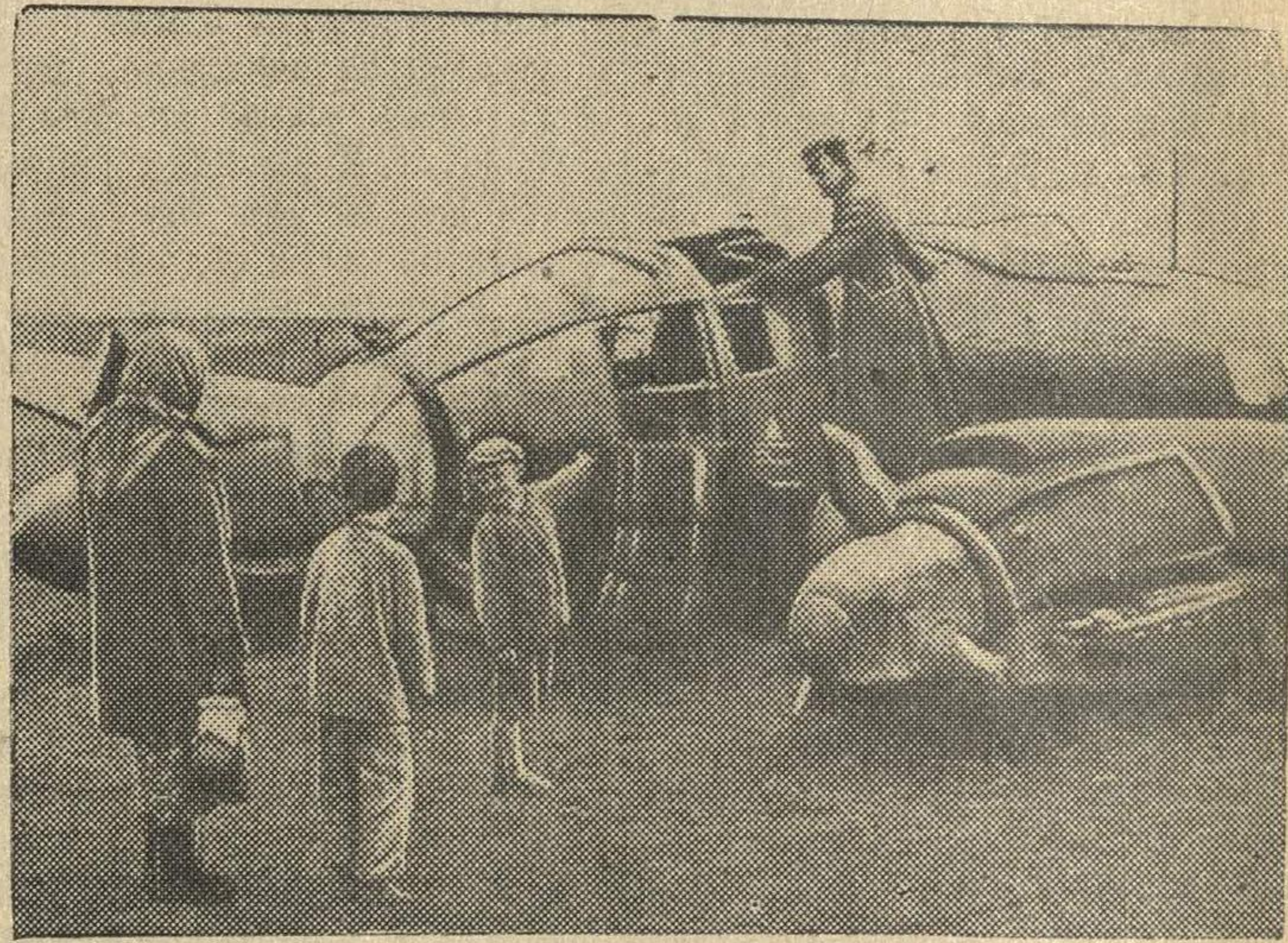
На фронтах отечественной войны (Западное направление). Подбитый зенитчиками «Хейнкель-111».