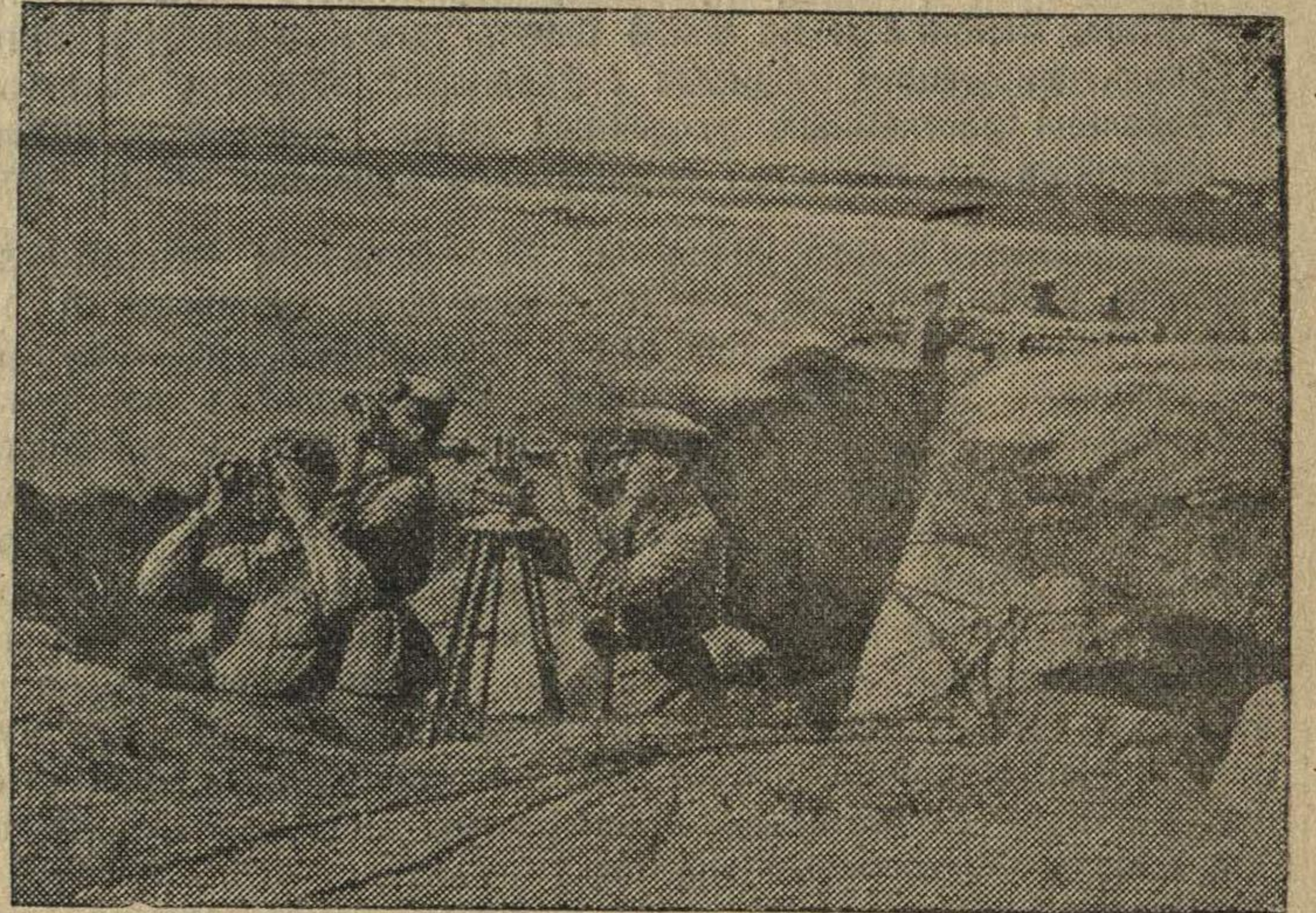
На фронтах отечественной войны. На наблюдательном пункте зенитной батареи.