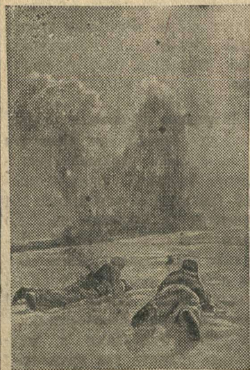
Саперы взрывают немецкие ДЗОТы под местечком М.

10 радиостанций, 25 мотоциклов, 130 велосипедов и много другого военного имущества.