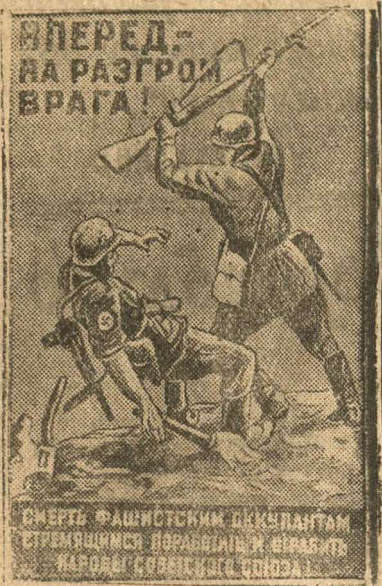
Плакат работы художника Д. Шмаринова, выпущенный издательством «Искусство»