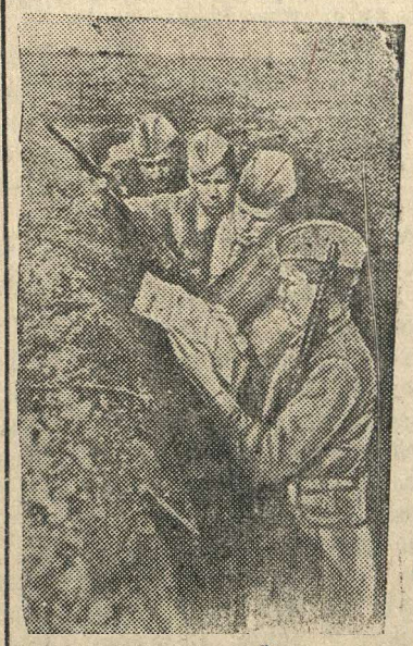
Герой Советского Союза механик-водитель танка комсомолец В. А. Григорьев.

У убитого немецкого солдата Людвига найдено письмо от некоей Гильды из Бетпропа. В нем говорится: «Отсюда, из Бетпропа, опять очень многих призвали. Берут буквально всех, кто имеет ноги и руки. Да, война натворила нам много бед. Здесь каждый день получают печальные известия... Вам тяжело, но и наша жизнь—сплошной ужас. Мне так надоело жить, что я способна с собой что-нибудь сделать».