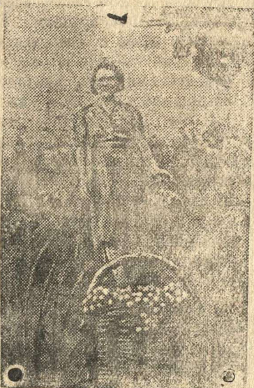
На снимке: Уборка винограда на участке совхоза.

В этом году совхоз имени Ильича (Сухумский район, Абхазская АССР), даст стране около 150 тонн винограда разных сортов. В совхозе уже началась уборка. Первая тонна собранного винограда была отправлена в госпитали.