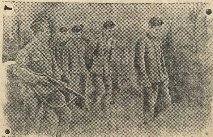
Группа гитлеровцев, захваченных в плен, направляется в тыл.