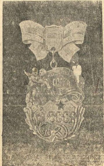
Орден „Материнская слава“ I степени