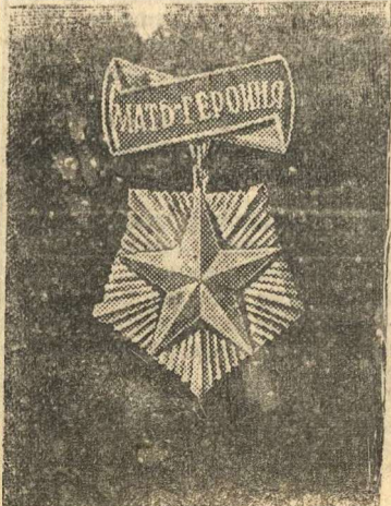
Орден „Мать Героиня“

За время с 29 августа по 4 сентября наши войска на всех фронтах подбили и уничтожили 193 немецких танка. В воздушных боях и огнем зенитной артиллерии сбито 130 самолетов противника.