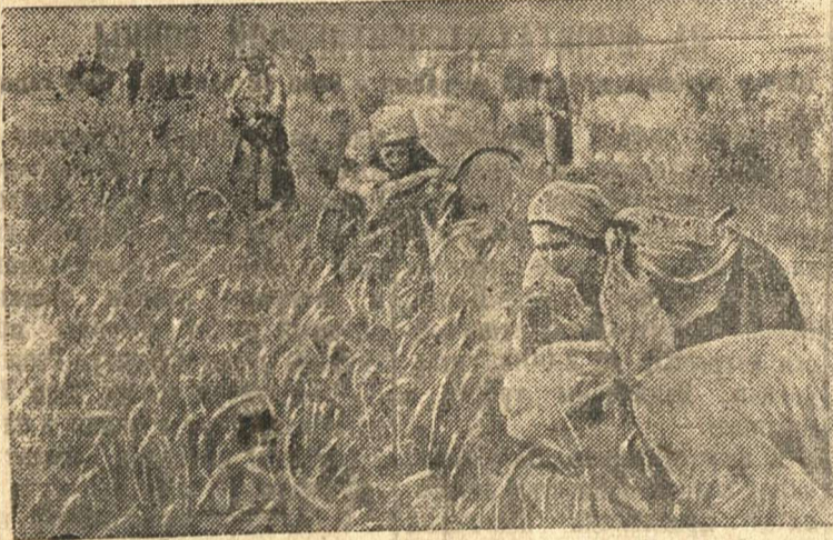
Уборка урожая в колхозе «Заможняк» (село Сахновка, Корсунь Шевченковского района, Киевской области).