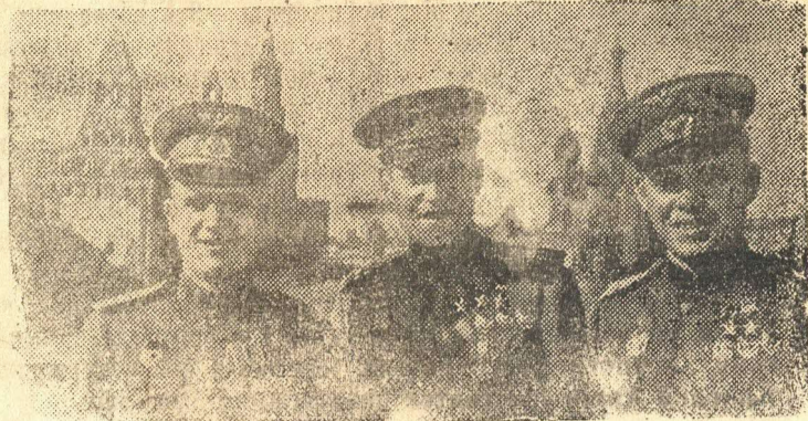
Сталинские соколы (слева направо) дважды Герой Советского Союза гвардии капитан И. Д. Гулаев, трижды Герой Советского Союза гвардии полковник А. И. Покрышкин, дважды Герой Советского Союза гвардии капитан Г. А. Речкалов.

В воздушных боях и огнем зенитной артиллерии сбит 131 самолет противника.