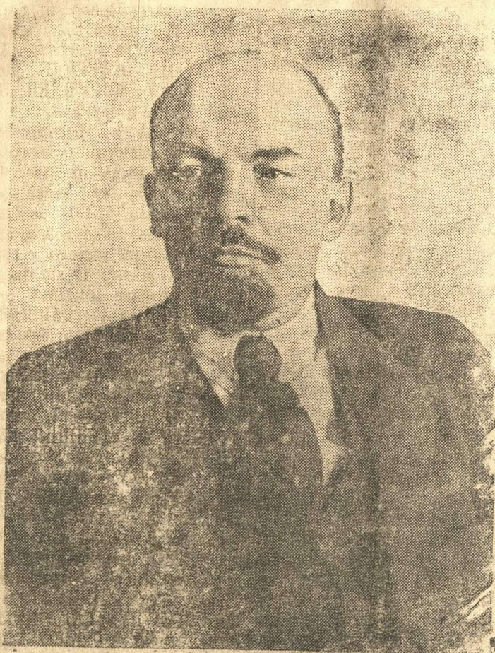
Владимир Ильич ЛЕНИН (1870—1924 г. г.)

Великая всепобеждающая сила нашего государства заключается в том, что, по заветам Ленина, под руководством Сталина, в нашей стране был создан новый, социалистический строй. В невиданно короткие исторические сроки отсталая, аграрная, экономически зависимая страна была превращена в могучую индустриальную и колхозную державу. Созданные за время сталинских пятилеток мощная социалистическая индустрия и колхозный строй явились основной базой для успешного ведения длительной, небывалой по масштабам войны, навязанной нам фашистскими