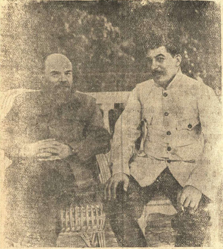
В. И. ЛЕНИН и И. В. СТАЛИН в Горках (1922 г.)

(Обзор военных действий за время с 17 по 23 января 1945 года)