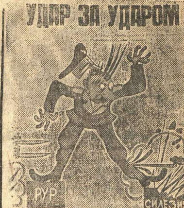
УДАР ЗА УДАРОМ. ДРОЖИТ ГИТЛЕР НЕДАРОМ: УДАР СЛЕДУЕТ ЗА УДАРОМ. НЕ ОСТАНЕТСЯ У ГИТЛЕРА СКОРО НИ ОДНОЙ ТОЧКИ ОПОРЫ