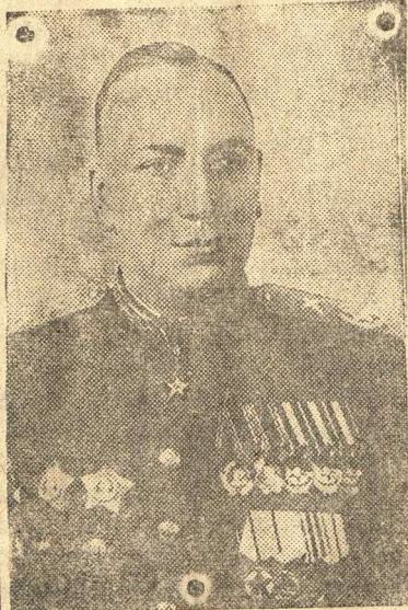
Главный Маршал артиллерии Николай Николаевич Воронов.

Получить высокий урожай в 1945 г.—такова задача всех работников МТС и ее надо решать по-боевому.