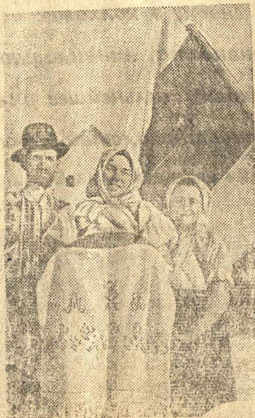
Второй Украинский фронт

Войска 3-го Белорусского фронта, после двухдневных упорных боев, 9 апреля штурмом овладели крепостью и главным городом Восточной Пруссии — КЕНИГСБЕРГОМ. Кенигсбергская группа немецких войск разгромлена. Остатки гарнизона во главе с комендантом крепости генералом фон инфантерии Ляш и его штабом прекратили сопротивление и сложили оружие. Взято в плен 92 тысячи немецких солдат и офицеров. В числе пленных 4 генерала. Захвачено более 2.000 полевых орудий, 89 танков и самоходных орудий, 774 паровоза, 8 544 вагона, 146 катеров и барж, 441 склад с военным имуществом и другие трофеи. Противник потерял убитыми до 42 тысяч своих солдат и офицеров. В боях за Кенигсберг советские воины вписали еще одну славную страницу в историю героической борьбы Красной Армии против немецко-фашистских захватчиков.