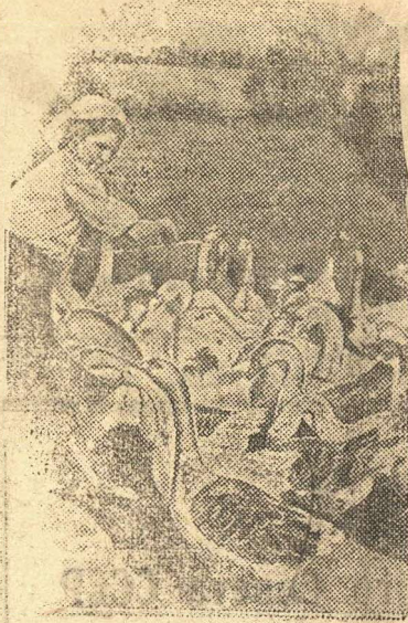
В передовом по развитию птицеводства и животноводства колхозе «Путь Ленина» Вичугского района Ивановской области.