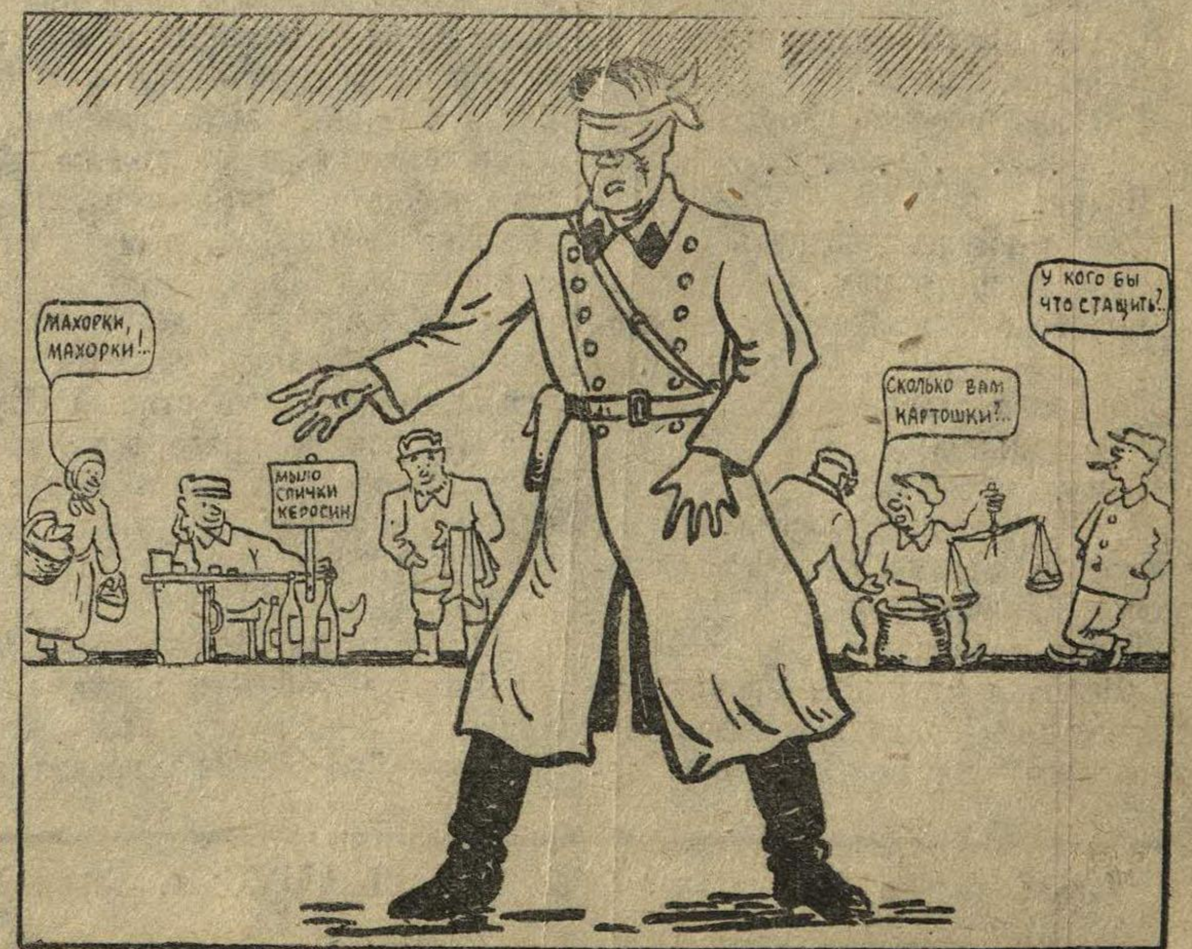
или как в Арзамасе «борются» со спекуляцией.