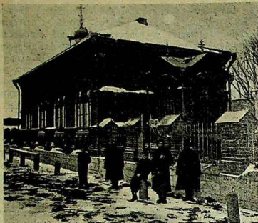
Наружный вид чертенского старообрядческого храма Рождества Богородицы.