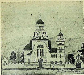
Планъ старообрядческаго храма во Владиміръ на Клязьмѣ.

пожертвовать на создание храма 5,000 рублей; такую же сумму пожертвовать и С. П. Араамовым; оказали и другія лица свою любовь къ дому Божію поспыльными и усердными своими жертвованиями. Очень радуется насъ такое воистину христіанское отношеніе къ храму молитвы нашихъ одновѣрцевъ. Богъ поможетъ, и мы будемъ возносить Ему молитвы наши въ великолѣпномъ храмѣ.