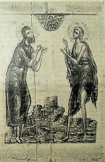
Св. Алексій челоуѣкъ Божій и пр. Марія Египетская.