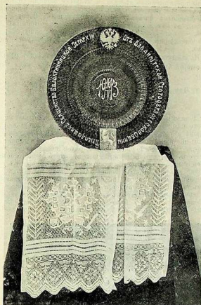
Блюдо, на котором поднесена владимирскими старообрядцами хлѣбъ-соль Государю Императору.