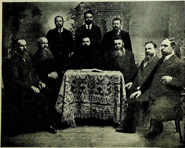
Совѣтъ старообрядческой общины при храмѣ во имя Рождества Пресвятыя Богородицы въ г. Новозыбковѣ.

Движимые чувствомъ глубочайшей признательности и высоко цѣня ваши труды на пользу святой Церкви и нашей общины и следуя наставленію апостола Павла, который въ своемъ посланіи говорить: «Позинайте братію труждающихся у васъ», мы нижеподписавшиеся, прихожане храма во имя Рождества Пресвятыя Богородицы, въ этотъ день вспоминаемъ, высокочитимый Ѳ. П., понесенные вами труды при постройкѣ храма. Благодаря вашей энергій, неустанному труду, въ сравнительно короткое время воздвигнутъ великолѣпный храмъ, который во всѣхъ отношеніяхъ вполнѣ соответствуетъ тѣмъ желаніямъ, которыя высказывались обществомъ. Особенно же мы вамъ благодарны за соблюденіе на пользу нашей общины матеріальной экономіи, такъ какъ при всемъ