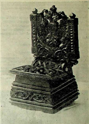
Солодка къ хлѣбъ-соли, поднесенной Государю Императору владимирскими старообрядцами.