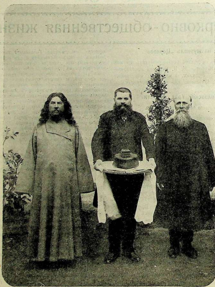
Депутатія Владимирскихъ старообрядцевъ, подносящая Государю Императору хлѣбъ-соль (см. корреспонденцію изъ г. Владимира).

Государь посѣтилъ Успенскій соборъ и затѣмъ отправился въ Суздаля. Громадное стеченіе публики привѣтствовало Высочайшихъ Особъ несмолкаемымъ громкимъ «ура».