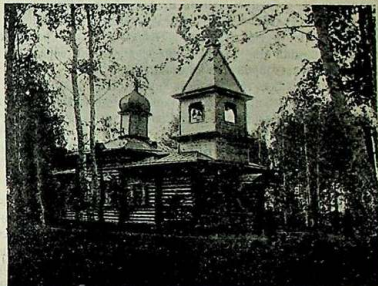
Покровский храмъ въ Д. Обухова.