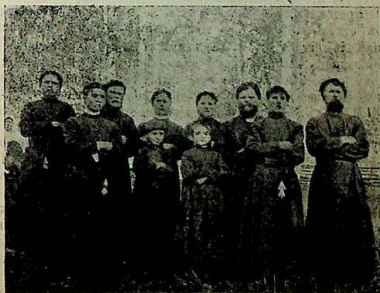
Хоръ пѣвцовъ-любителей въ Д. Обухова.

Храмъ былъ переполненъ молящимися; нѣкоторые стояли въ оградѣ храма. Очень много молящихся было изъ Екатеринбургга и окрестныхъ деревень. Пришли послушать и посмотреть на торжество и единоврѣдцы, новообрядцы и безпоповцы. Для нихъ это торжество невиданное и неслыханное. Они поражены торжествомъ древле-православной вѣры. Они говорили: «У насъ не можетъ быть такого торжества. У старообрядцевъ, какъ-то особенно торжествуется, такъ и хочется воедино съ ними прав-