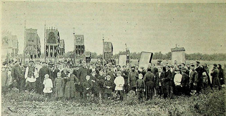
Село Борисово. Шествие крестного хода вокруг садовъ, полей и села Борисова.

были для участия въ означенномъ шествіи крестный ходъ изъ Успенскаго собора съ Новоселенской улицы. Въ крестномъ ходу участвовали: огромнаго размѣра древняго письма св. икона Царицы Небесной «Іерусалимской», образъ Спасителя и святаго Николая; всѣ три несомы были на специально изготовленныхъ носилкахъ. Царица Небесная въ драгоценной серебряной ризѣ, сооруженной обществомъ хоругвеносцевъ съ