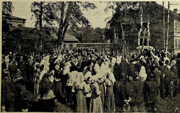
Передъ поднітіемъ св. креста на колокольню вновь сооружаемаго храма на Громовскомъ кладбищѣ въ Петербургѣ.