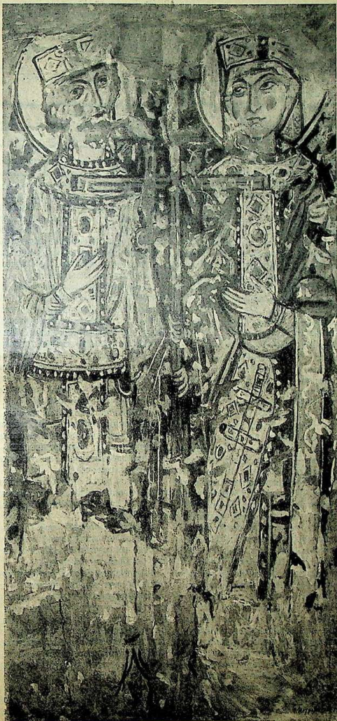
Равноапостольные Константинъ и Елена. Фрески новгородскаго Софійскаго собора XI вѣка.

Ликійскій женился на своей сестрѣ Константина Констанціи и въ началѣ 313 года лично прибылъ на Востоку съ своими болѣею частью христіанскими легіонами. Максимианъ въ короткое время собралъ огромное войско, привелъ въ смятеніе всѣ города и началъ военныя дѣйствія противъ Ликіи. Но опять не имѣя никакого успѣха. 30-го апрѣля 313 г. гололо Адрианопаля Максимианъ былъ разбитъ. Сначала погибли тяжело воору-