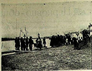
Освященіе воды на р. Барда при с. Тюриковѣ, Кунгур. уѣзда, Пермской губ.

Собравшійся въ храмъ на молитву народъ не могъ удержаться отъ радостныхъ слезъ, такъ трогательно было сіе торжество. Видя наши теплыя молитвы къ Богу, пришли въ