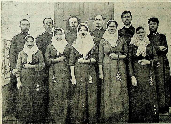
Часть хора любителей при старообр. храмѣ въ г. Богородскѣ, принимавшихъ участіе при богослуженіи въ храмѣ Сергіевскаго посада, Московской губ.