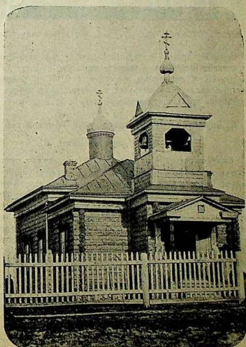
Храмъ во имя св. великомученика Георгія при дерев. Левино, Владим. губ., Судогод. уѣзда.