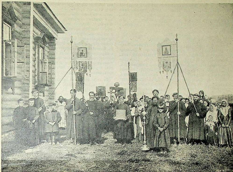
Крестный ходъ вокругъ храма въ д. Левино, Владим. губ.