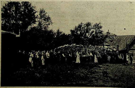
Крестный ходъ изъ с. Б.-Мурашино, въ д. Тыново. Выходъ изъ храма.