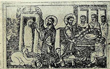
Миниат. кодекса Григорія В. „Воскресеніе Лазаря“ IX в.

Столь замѣчательный памятникъ не позволяетъ пройти молчаливо мимо него, и мы считаемъ необходимымъ представить въ своихъ очеркахъ одну изъ миниатюръ изъ этого памятника IX столѣтія (смотри рис. 12) 1)