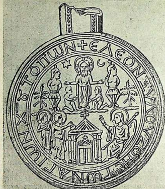
„Ампула Монцы“, начала VII в. (Рис. 11)

Въ этомъ же убѣждаютъ насъ и памятники VII вѣка. Здѣсь переходною ступеню отъ VI столѣтія, въ смыслѣ постепенности исторіи перестосложения, служатъ рельефы изображенія на такъ называемыхъ «ампулахъ»—металлическихъ и глиняныхъ фиалкахъ, которыя были употребляемы пилигримами или паломниками для храненія «палестинскаго» елея во время путешествія изъ св. мѣстъ. Наибольшее число такихъ «ампулъ» хранится въ Монцѣ, въ церкви св. Іоанна, и считаются наследіемъ лонбардской королевы Теоданды. Въѣшнія стѣнки «ампулъ» обыкновенно изобилуютъ изображениями религиознаго характера, преимущественно сценами изъ евангельскихъ событий. На взятомъ нами снимкѣ «ампулы Монцы» (рис. 11) можно видѣть два такихъ событія евангельской исторіи: въ верхней части—Христосъ, распятый между двумя разбойниками, а въ нижней—явленіе