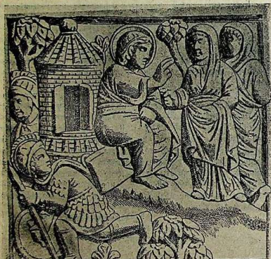
Часть Миланского диптиха V в. (рис 7).

римской древности диптихи перешли в христианское церковное употребление, где они стали служить для записи имен живых и умерших родственников христиан с целью поминовения. Отсюда, как полагают некоторые ученые, получили свое начало синодики или поминовения, так широко применяемые в настоящее время в церковной практике. Не мало этих древних диптихов сохранилось до нашего времени; по рельефным изображениям на их вышних сторонах можно судить о многих особенностях быта того времени и в частности о переломлении для крестного знамения и благословения. Вот пред нами часть «миланского» диптиха V века (рис. 7), на котором изображено одно из