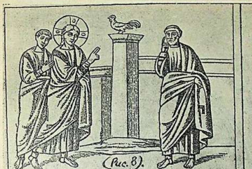
Мозаика равеннской церкви Аполлинария Нового VI в.

зантн лицевыхъ Евангелій, въ которыхъ христіанское искусство хотѣло наглядно передать реальность событій евангельской исторіи посредствомъ лицевыхъ изображеній. Здѣсь мы находимъ то же, что на фрескахъ и мозаикахъ: изображеніе притчъ Спасителя, чудесъ и наиболее важныхъ моментовъ Его земной жизни. Однимъ изъ наиболее цѣнныхъ памятниковъ этого рода является «Росанское» Евангеліе, которое по своимъ лицевымъ изображеніямъ можетъ быть названо лучшимъ памятникомъ VI столѣтія. Профессоръ Покровский при разсмотрѣніи этого памятника воспроизвелъ въ своемъ печатномъ трудѣ нѣсколько миниатюръ изъ этого Евангелія, въ числѣ которыхъ одна представляетъ притчу Спасителя «о мудрыхъ и глупыхъ дѣвахъ». Посредств. рисунка представлена дверь, по одну сторону которой изображенъ Христосъ съ мудрыми дѣвами, а по другую — неразумныя дѣвы, съ потушащими свѣчальниками. Онѣ настойчиво ударяютъ въ затворенную дверь, желая войти въ чертоги рая, но голосъ небеснаго Жениха рѣшительно отвѣчаетъ имъ: «Не вѣзь васъ!» 1) . («Памятн. прав. ик. и иск.», Покровскаго, стр. 167). Важность этой миниатюры для насъ заключается въ томъ, что Спаситель и здѣсь изображенъ съ двоверстнымъ сложеньемъ.