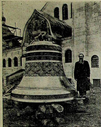
Мокошь, поднятый на старообрядческий храм в с. Балаково.

изъ большого числа районов нашего обширнаго сѣвера и притомъ такихъ лицъ, которыя по своему возвращенію на