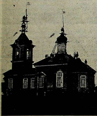
Поднятіе крестовъ на храмъ въ д. Столяровка, Уфимской губ.

В 6 верстахъ отъ хутора Лянчичева находится крестьянская слобода Ново-Петровка. Въ этой слободѣ открылась съ 20-го сентября забойная лѣгочная чума. Власть приняла энергичныя мѣры, чтобы не распространить изъ слободы въ другіе хутора эту страшную болѣзнь. Для болѣе строгой охраны наказанный атаманъ области Войска Донскаго выселить изъ