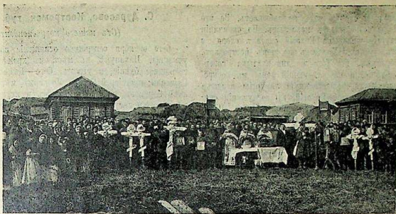
Крестный ходъ въ д. Столпковѣ, Уфимскія губ., при торжествѣ поднятія крестовъ на храмъ.