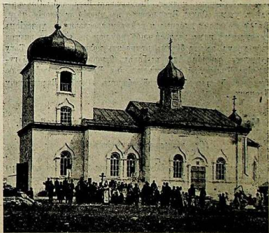
Храмъ въ Тирлянкѣ на заводѣ, Оренбургскія губ.