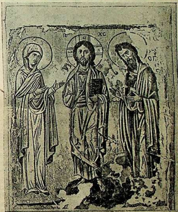
Изъ греческ. Четвероевангелія 1272 г., поднесеннаго Александрійскимъ патріархомъ Государыни Маріи Александровны. (Рис. 21).

Такова историческая цѣнность именословія и триперствія, фигурирующихъ на нѣкоторыхъ фрескахъ древне-русскихъ храмовъ. На всѣхъ же подлинно древнихъ фрескахъ и мозаикахъ, уцѣлѣвшихъ отъ варварской реставраціи, благосло-