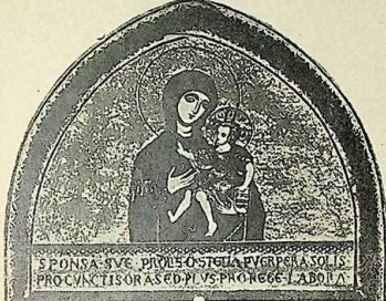
Мозаика надъ главнымъ входомъ въ соборъ въ Монреаль бл. Палермо, XIII в. (Рис. 20).

Представленный памятникъ говорить за то, что католическій западъ въ XIII вѣкѣ считался еще до нѣкоторой степени съ исторической правдой въ изображеніи перстосложенія, подражая очевидно памятникамъ своего прошлаго, въ изобиліи хранившихся въ богатѣйшихъ его хранилищахъ.