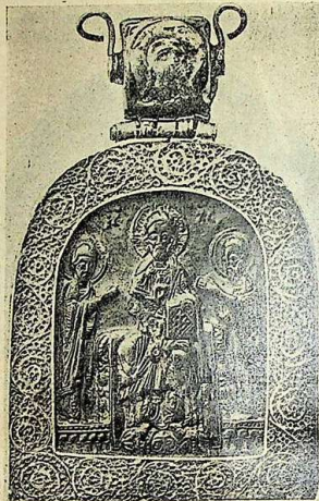
Рѣзная икона изъ чернаго камня XIII в. греческ. работы (рис. 23).

цвѣта; края образа обдѣланы въ рамку, внутри которой, въ углубленіи, помѣщается искусно выѣщенное поясное изображеніе святителя. По древнему обычаю, святитель облаченъ въ фелонь и охоротъ, кресты котораго рельефно выделяются на плащатъ и груди. Лѣвою рукою св. Николы изъ-подъ фелоня держитъ Евангеліе, правая же, весьма тщательно сложенная въ двоперстіе, представляется благословляющею. Надъ плечами святителя выѣщена греческая надпись: «агіосъ Николасъ». По опредѣленію ученыхъ археологовъ, образокъ относится къ произведенію греческаго искусства XIII столѣтія 2) . Что ученые изслѣдователи не ошиблись въ датировкѣ даннаго