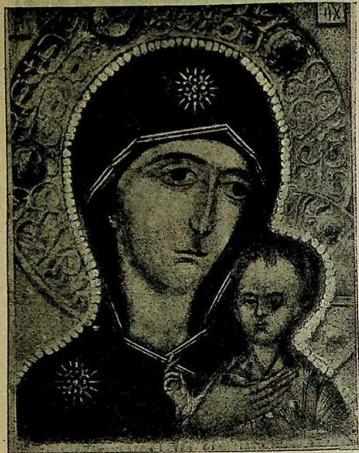
„Петровская“ икона Б. М. XIV в. в ризнице св. Троице-Сергиевск. лавры. (Рис. 25).

того живописца. Список этой иконы представляет собою нечто особую особенность в сравнении с другими аналогичными иконами как положением сидящего Божественного Младенца, так и Его перстосложенной руки, обращенной к себѣ. Только въ одномъ неизмѣнно общи всѣ памятники св. старины, это — въ изображении двоеперстного сложения, которое красной нитью проходит по всей христіанской исторіи, какъ по-казатель всеобщности сего послѣдняго въ древнее время. Со стороны исторіи мы видимъ полное подтвержденіе свѣдѣтельству иконографическихъ памятниковъ какъ въ Россіи, такъ и въ Греціи. Къ этому именно времени относится дозволѣніе въ греческихъ книгахъ извѣстнаго изреченія въ огражденіе двоеперстія: «Аще кто не знаменуется двумя персты яко же Христосъ, да будетъ проклятъ». Профессоръ Голубинскій, научно разбирая это изреченіе, приходитъ къ слѣдующему заключенію: «Мы считаемъ за вѣроятнѣйшее думать, что наше: «аще кто не знаменуется...» дѣйствительно есть переводъ греческаго: εἰ τις οὐκ ἐκσταθῆτι μετὰ δύο δάκτυλα ὡς καὶ Χριστός , въ сѣми историческомъ, какъ указалъ Андрей Демисовъ въ Поморскихъ отвѣтахъ. На этики нисколько не будетъ языкомъ новымъ для грека XII—XIII вѣка» 1) .