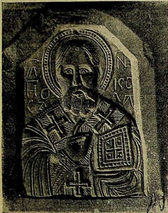
Каменный образокъ св. Николы XIII в. (рис. 22).

образка, можно судить по аналогичному памятнику, научно установленному. — образку изъ чернаго камня и тоже греческой работы XIII вѣка, хранившемуся въ собраніи древностей христіанскихъ Н. М. Постникова. Образокъ представляетъ «Денусъ». Христосъ Спаситель изображенъ здѣсь сидящимъ «на престоѣ славы». Двоперстное сложѣніе Его руки свидѣтельствуетъ о перстосложѣніи того времени (Рис. 23) 1) .