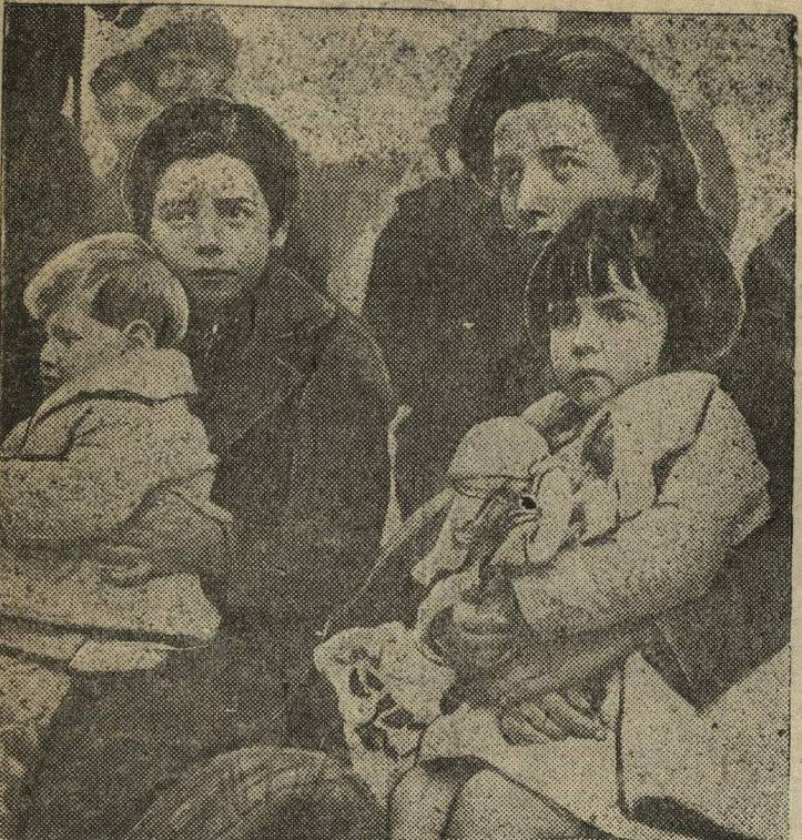
Жители Каталонии, не желая оставаться под властью фашистских германо-итальянских интервентов, покидают свою родину. На снимке: беженцы из Каталонии в одном из пограничных пунктов на франко-испанской границе. Фотохроника.