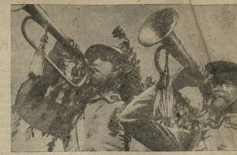
Горнисты китайской армии.