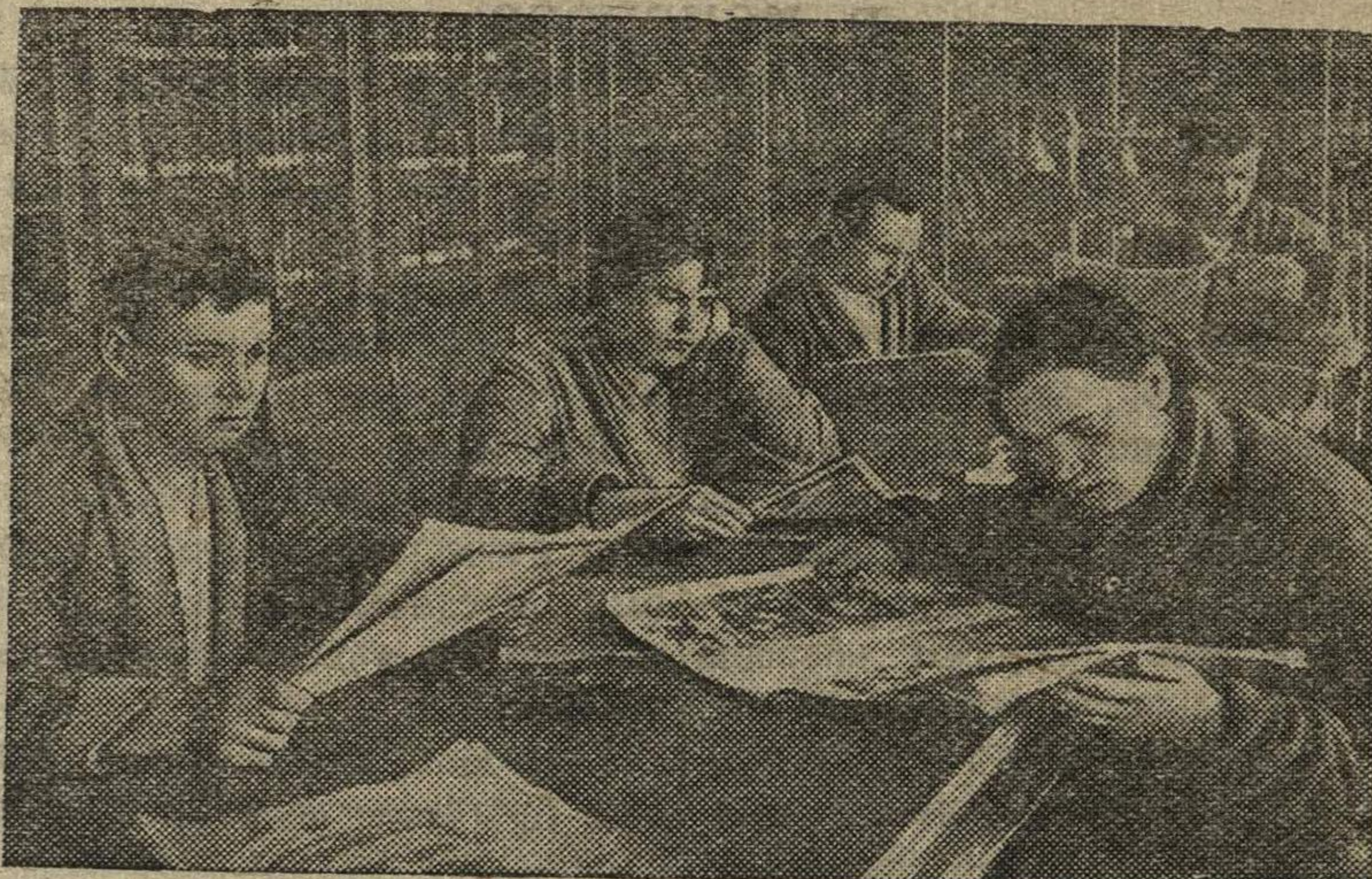
В читальне Украинского института экспериментальной офтальмологии (Одесса). Сюда приходят читать книги, журналы и газеты бывшие слепые, которым академик профессор В. П. Филатов возвратил зрение.