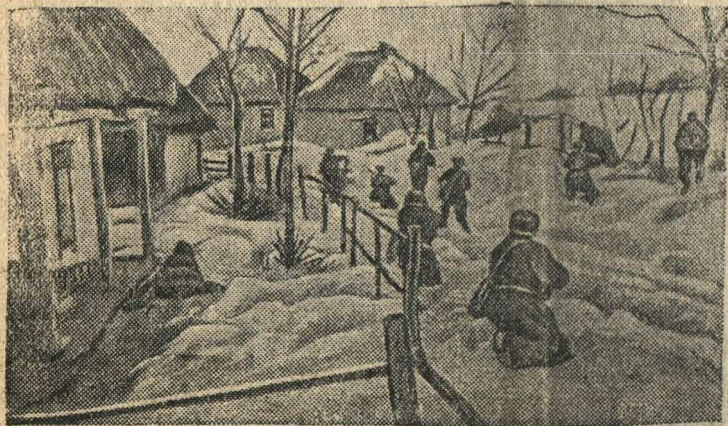
Бойцы Н-ской части выбивают немцев из села Н.