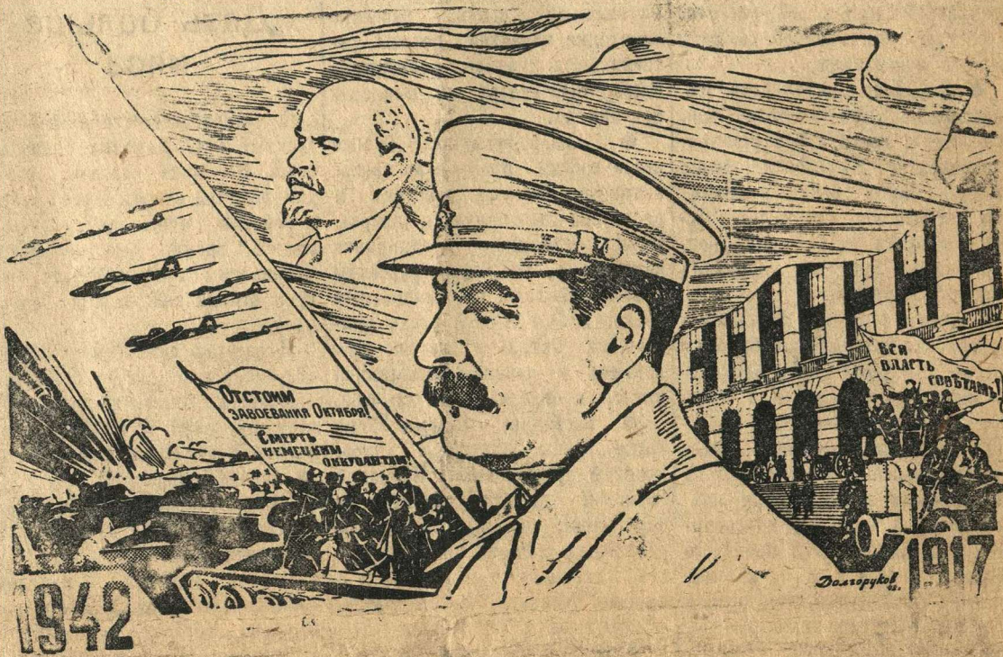
Рисунок худ. Н. А. Долгорукоева

городов, тысячи селений, угнал в постылое рабство сотни тысяч наших братьев. Но фашистские бандиты не сломили и никогда не сломают воли нашего народа к борьбе. Его веры в победу. Не для того мы 25 лет назад совершили революцию, не для того мы строили нашу свободную, счастливую жизнь, чтобы уступить ее кровавым фашистским разбойникам и людоедам.