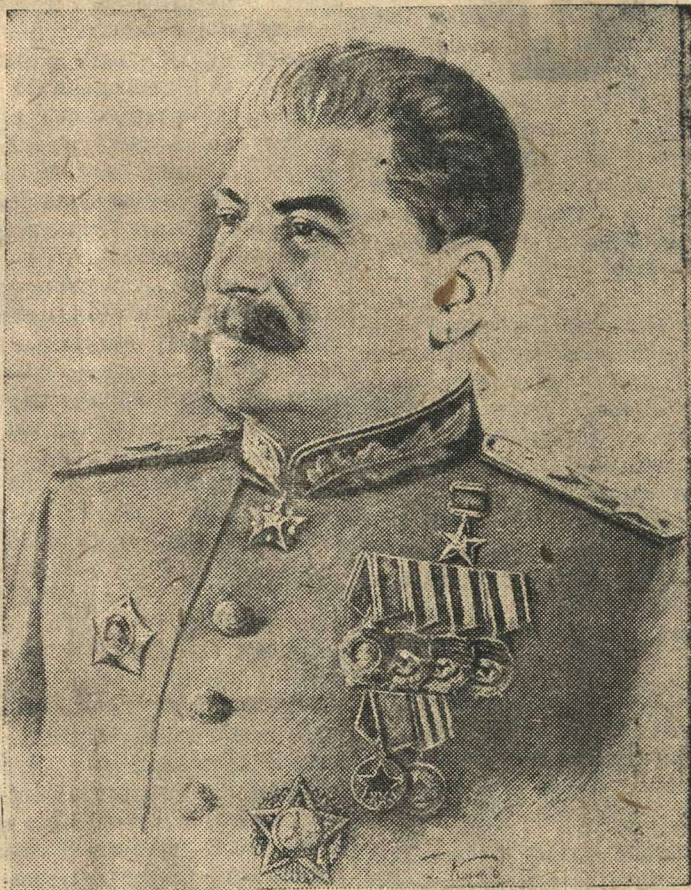
Председатель Совета Народных Комиссаров Союза ССР Генералиссимус Советского Союза И. В. СТАЛИН.

Советские люди хорошо знают, что защита Отечества есть священный долг каждого гражданина СССР. И когда коварный враг напал на нашу Родину, весь народ по зову партии Ленина — Сталина, поднялся на борьбу с гитлеровскими захватчиками. Со-