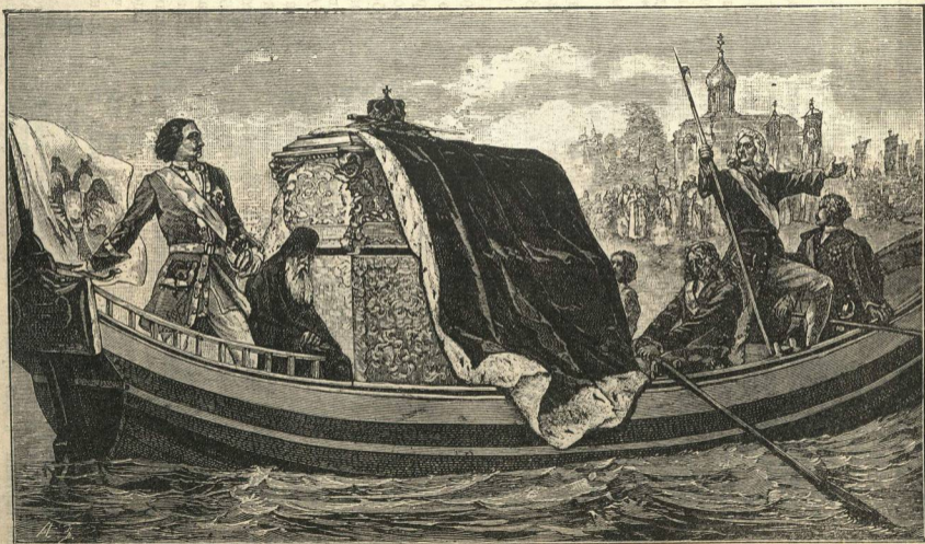
Перенесеніе Петрою I мощей св. Александра-Невскаго въ С.-Петербургъ, въ 1723 г.