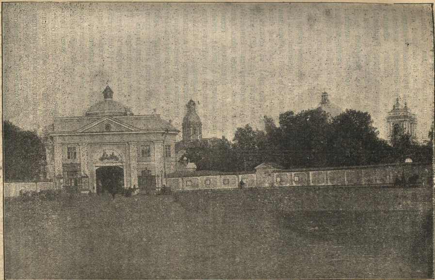
Общій видъ Александро-Невской лавры съ Невского проспекта.