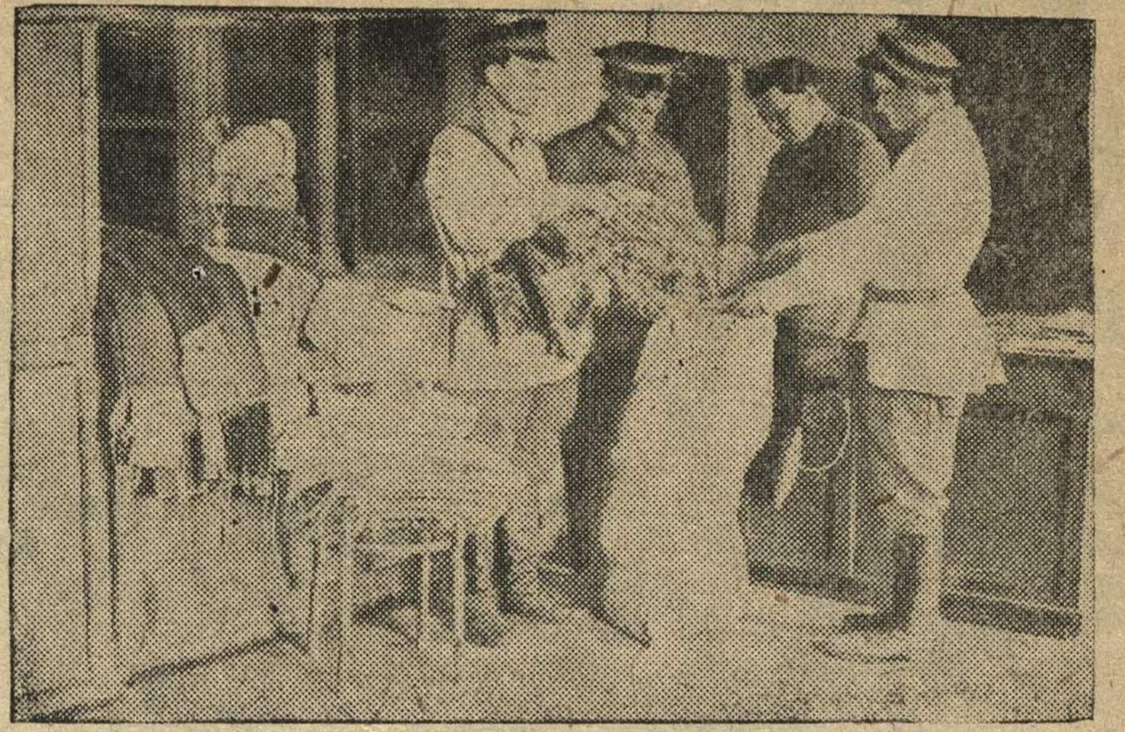
Работники Автозаводского ГОМ сдают теплые вещи для бойцов Красной Армии.