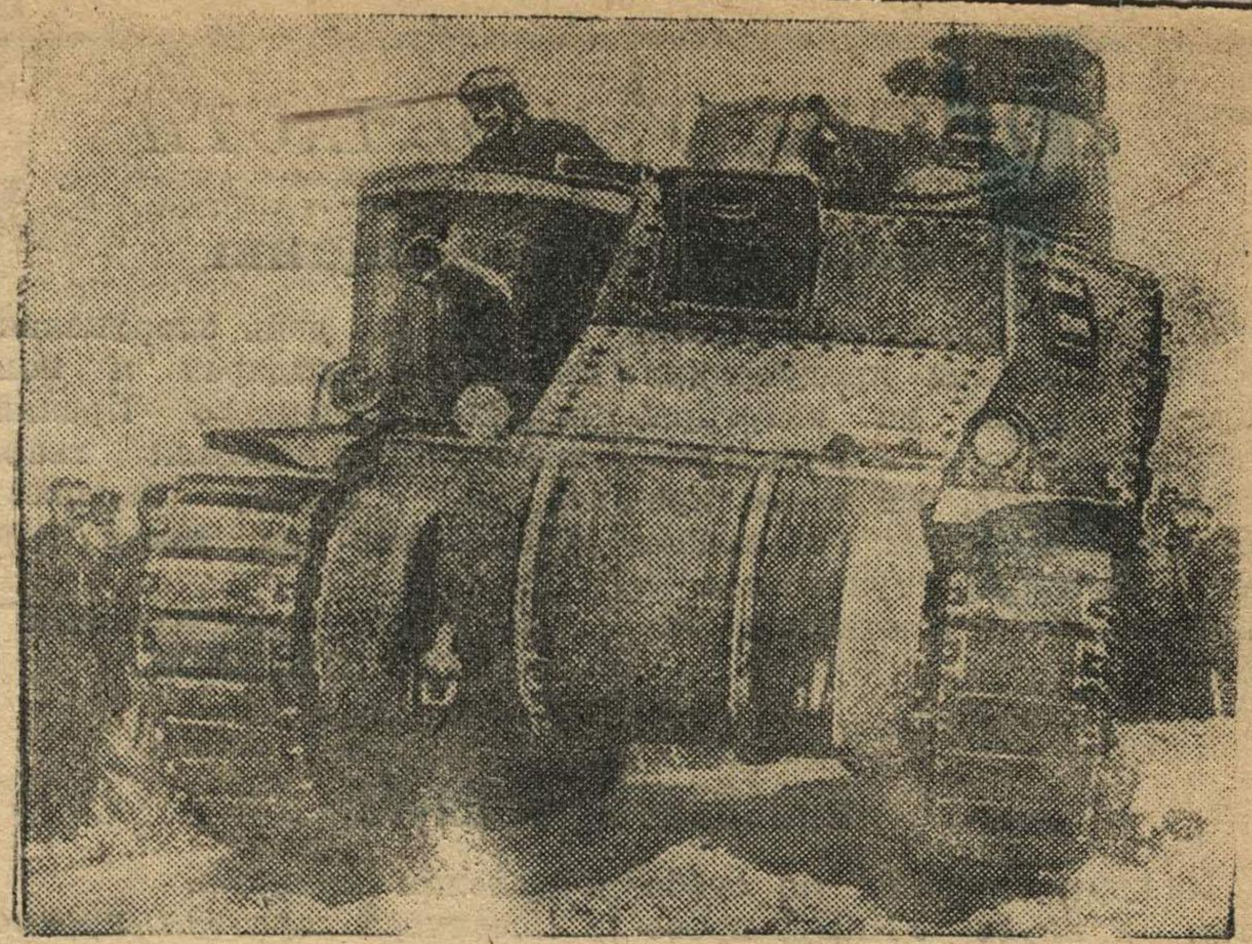
25-тонный танк принятый на вооружение в американской армии.

Начальник паспортного стола 6 отделения милиции гор. Горького тов. Велетминская обменяла спецудостоверения гражданам Агафонову и Ай-малетдинову на временные удостоверения без представления требующихся для этого документов.