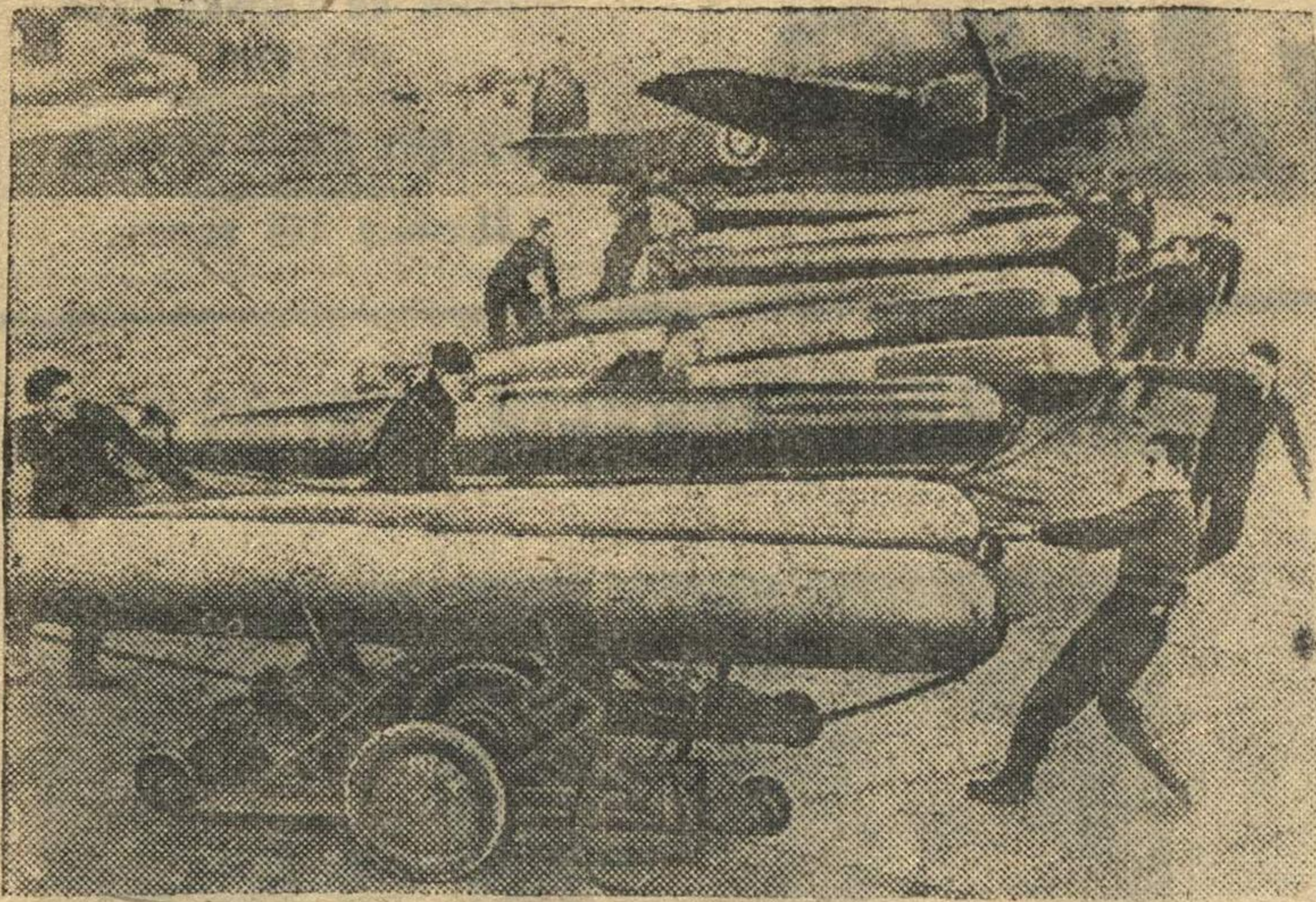
На аэродроме перед боевым вылетом.