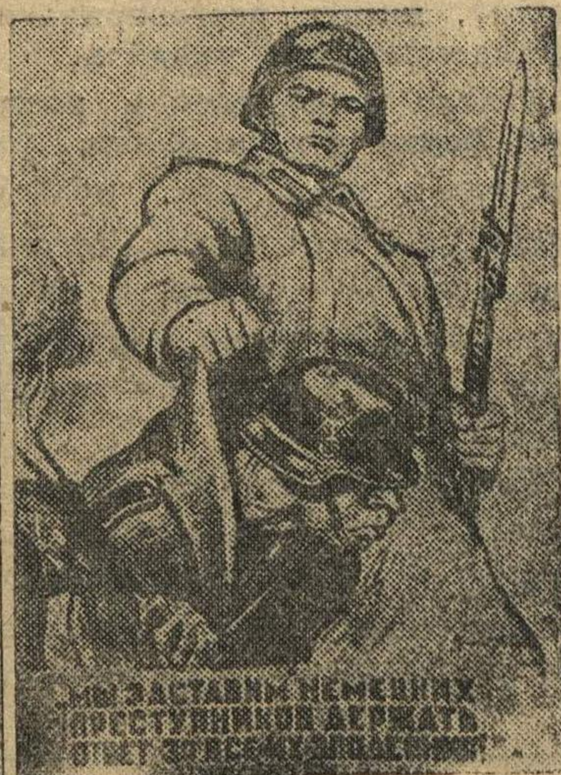
Плакат работы художника И. Тоидзе.