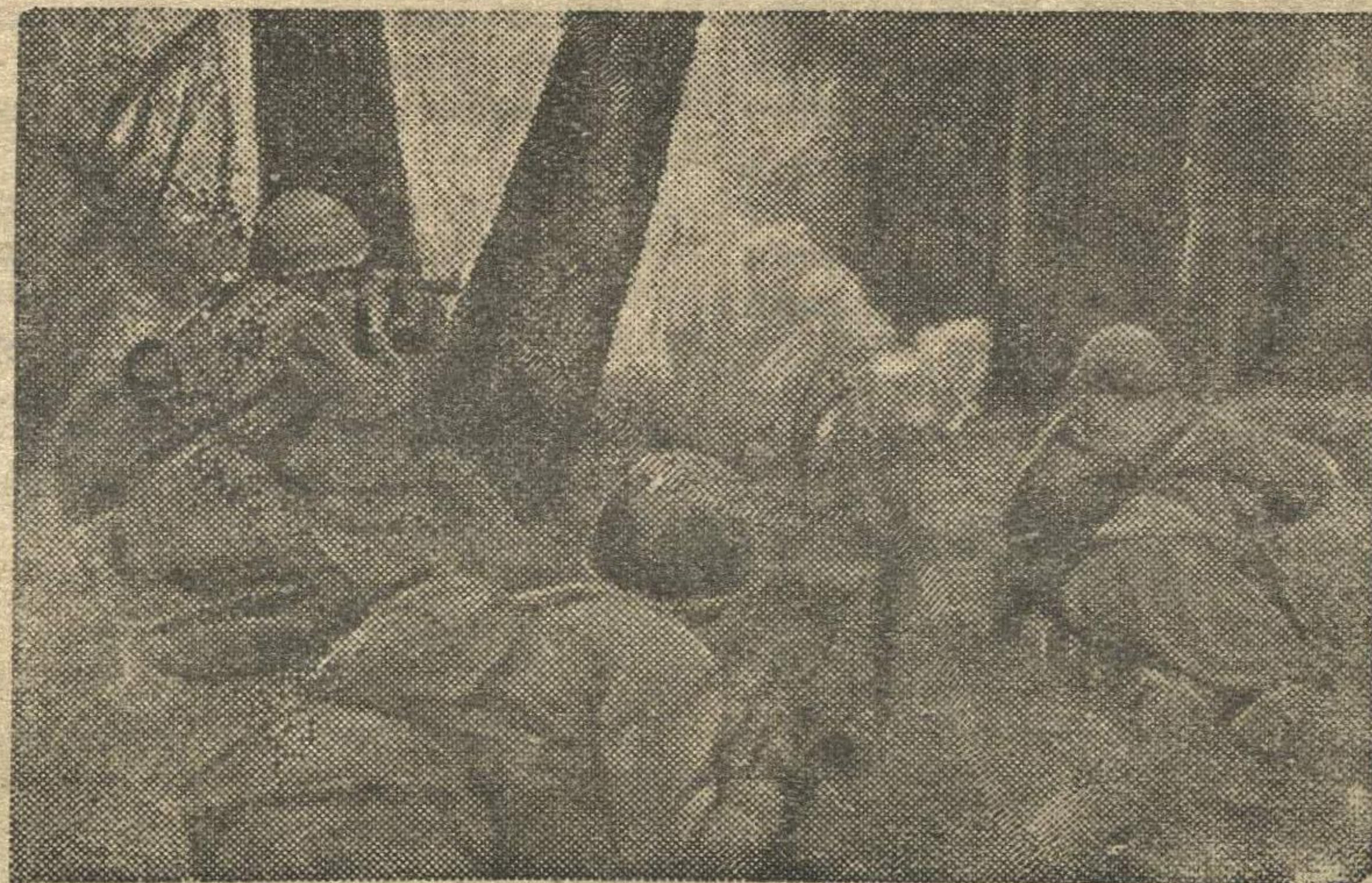
В ПОЛЬШЕ. Подразделение лейтенанта Викторова выбивает противника из леса.