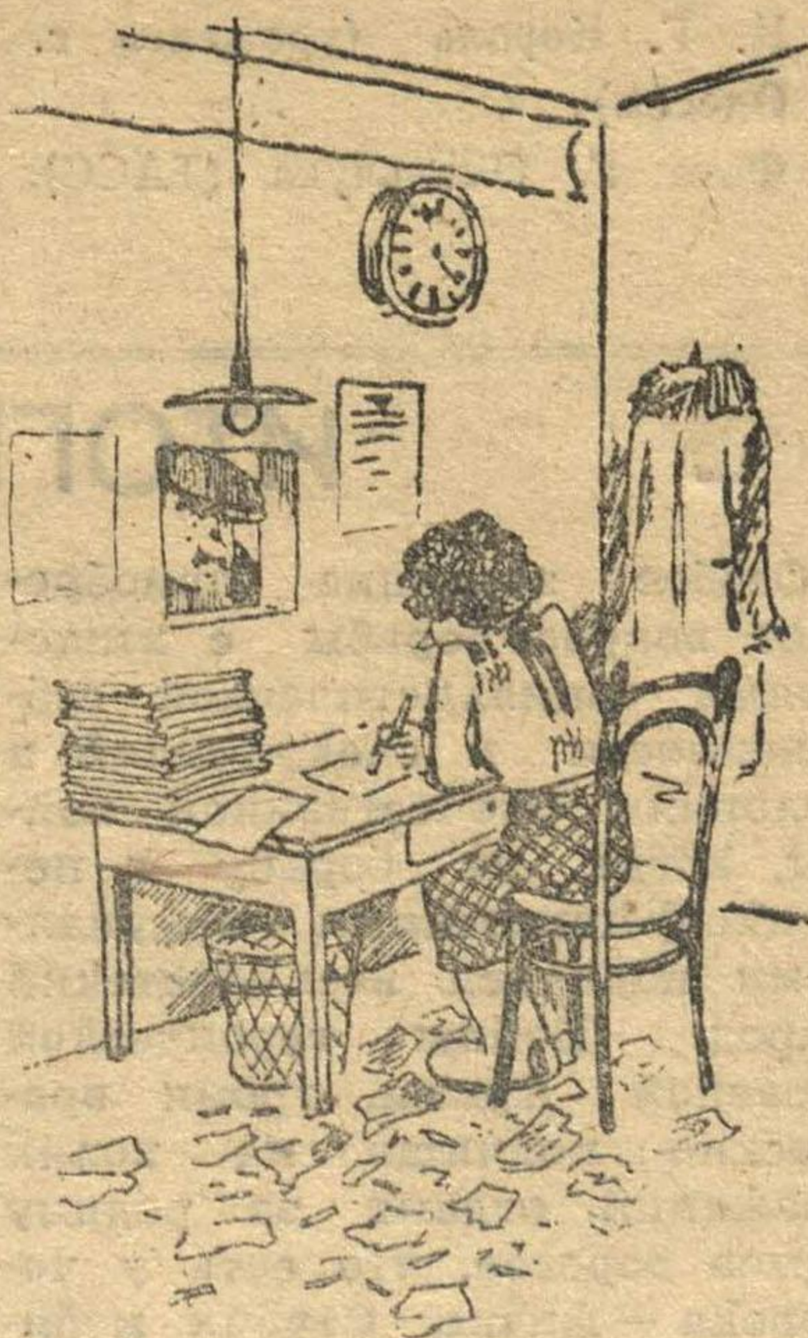
Она сидит, потупя взор, С людьми беспечна, безразлична. Ее труды—забросан пол Различным мусором, обрывками И шелухой семечек уж зарастает стол.