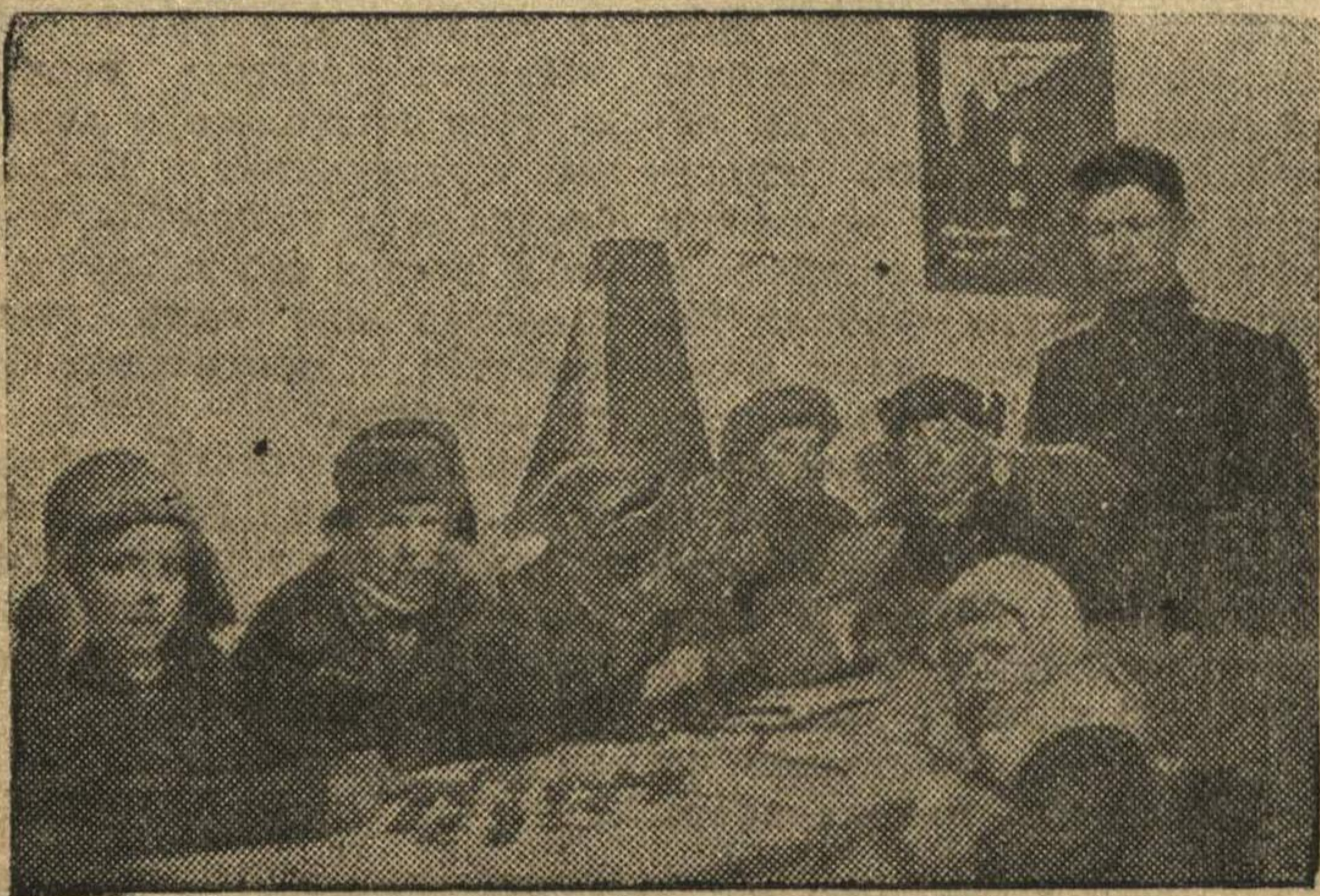
В детской комнате приводов Богородского горотдела НКВД.