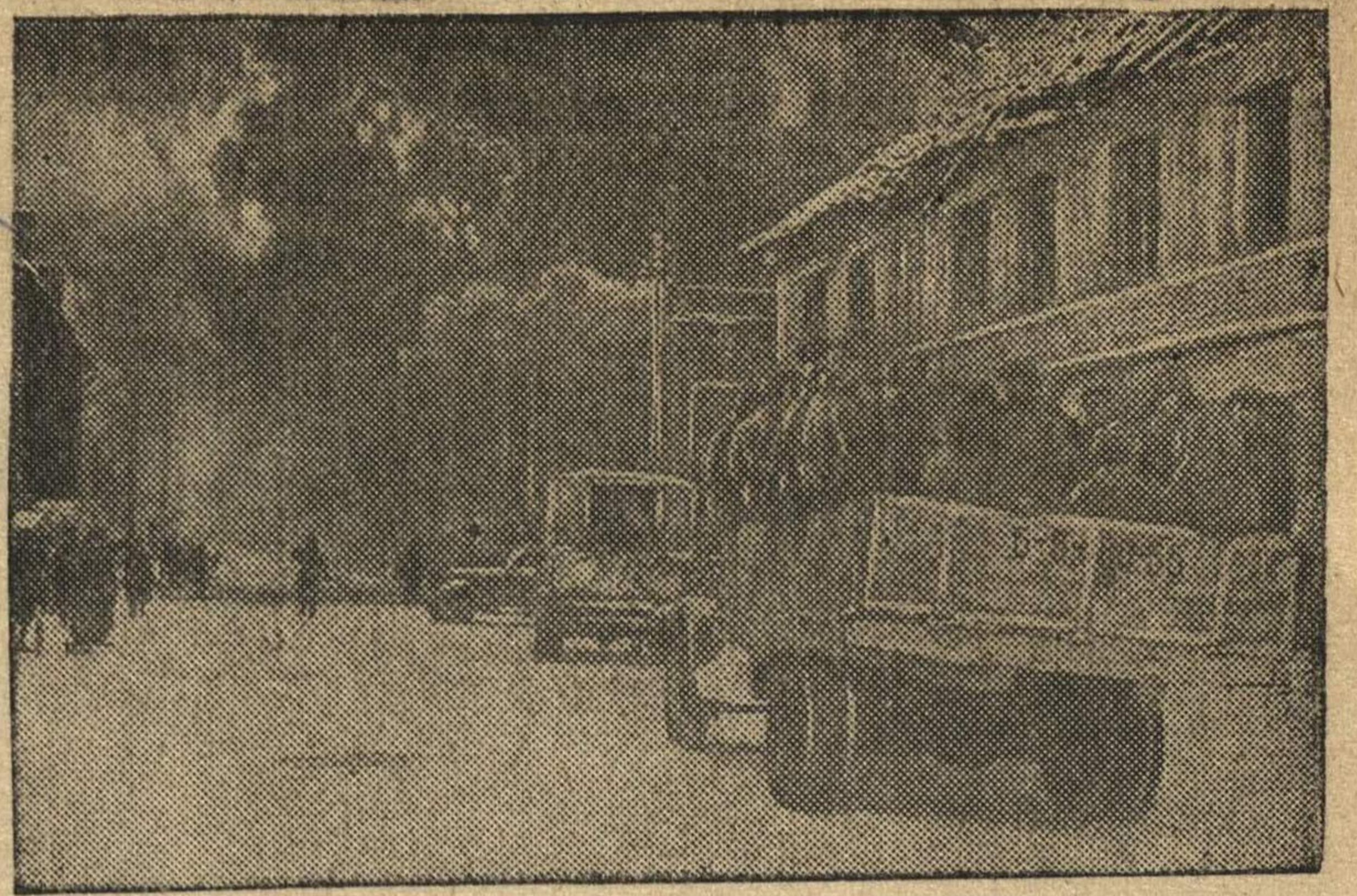
В Восточной Пруссии. Части Красной Армии проходят через немецкий город Тильзит.