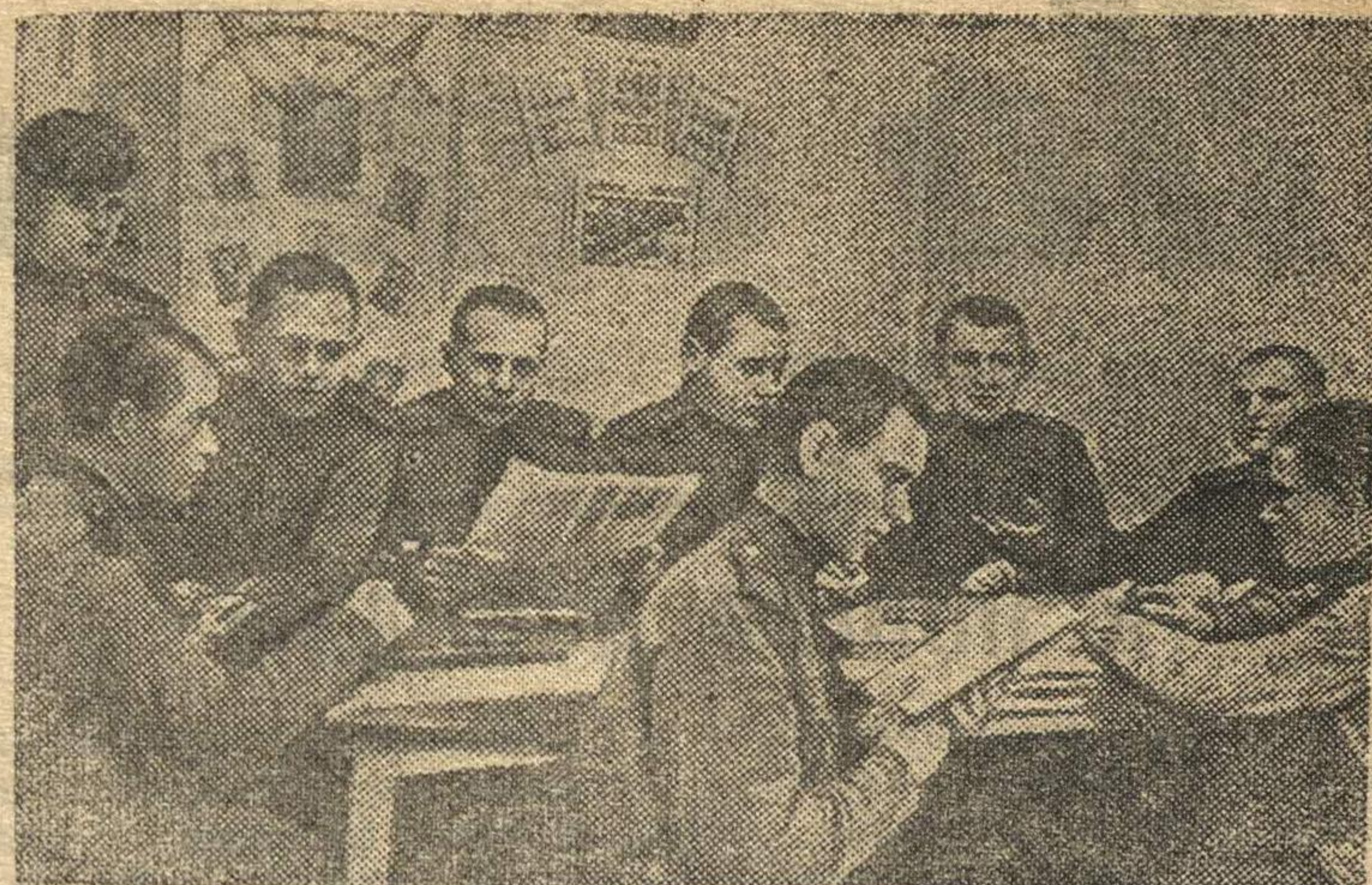
ДЕЙСТВУЮЩАЯ АРМИЯ. В читальном зале полковой библиотеки. Бойцы, сержанты и офицеры Красной Армии в часы досуга читают газеты, журналы и художественную литературу.