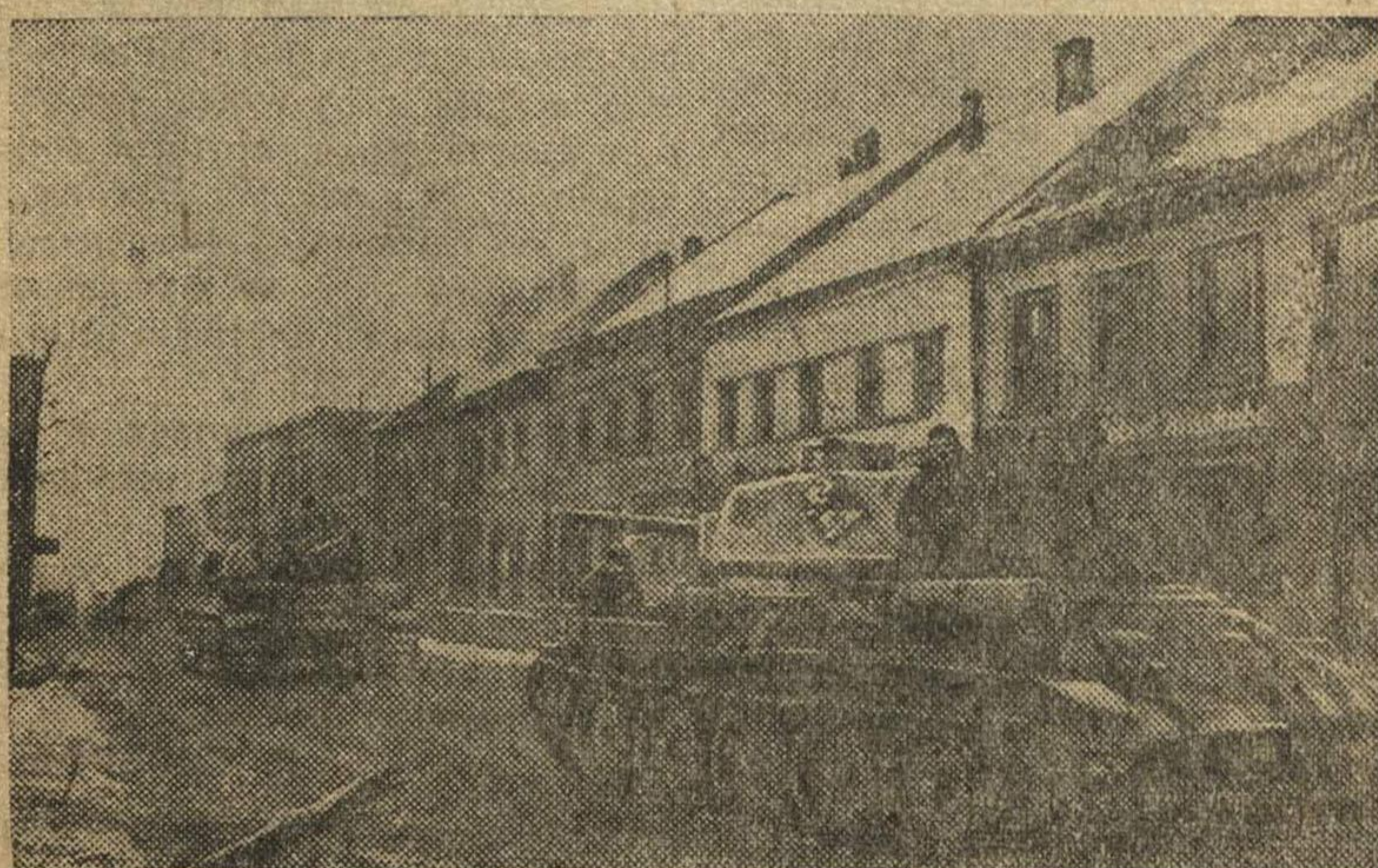
В немецкой Силезии. Советские танки проходят по улицам города Тост.