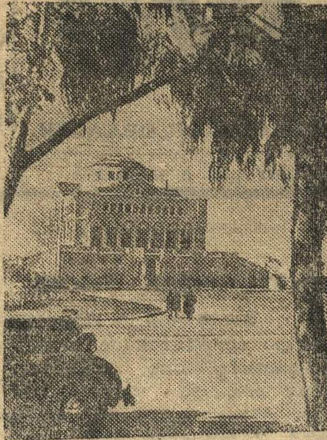
Здание Государственного театра в городе Потти (Грузия).