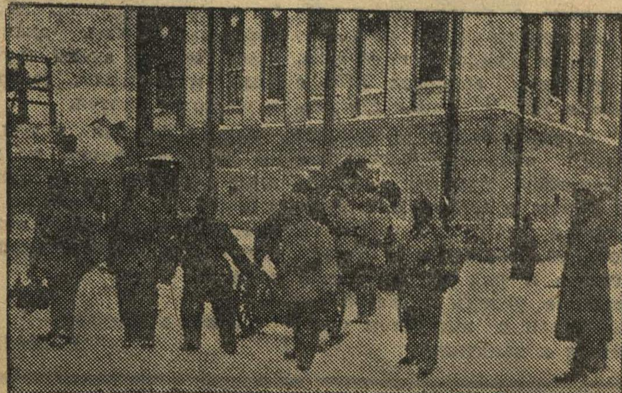
Практические занятия подразделения 3-ВТПК НКВД г. Горького.