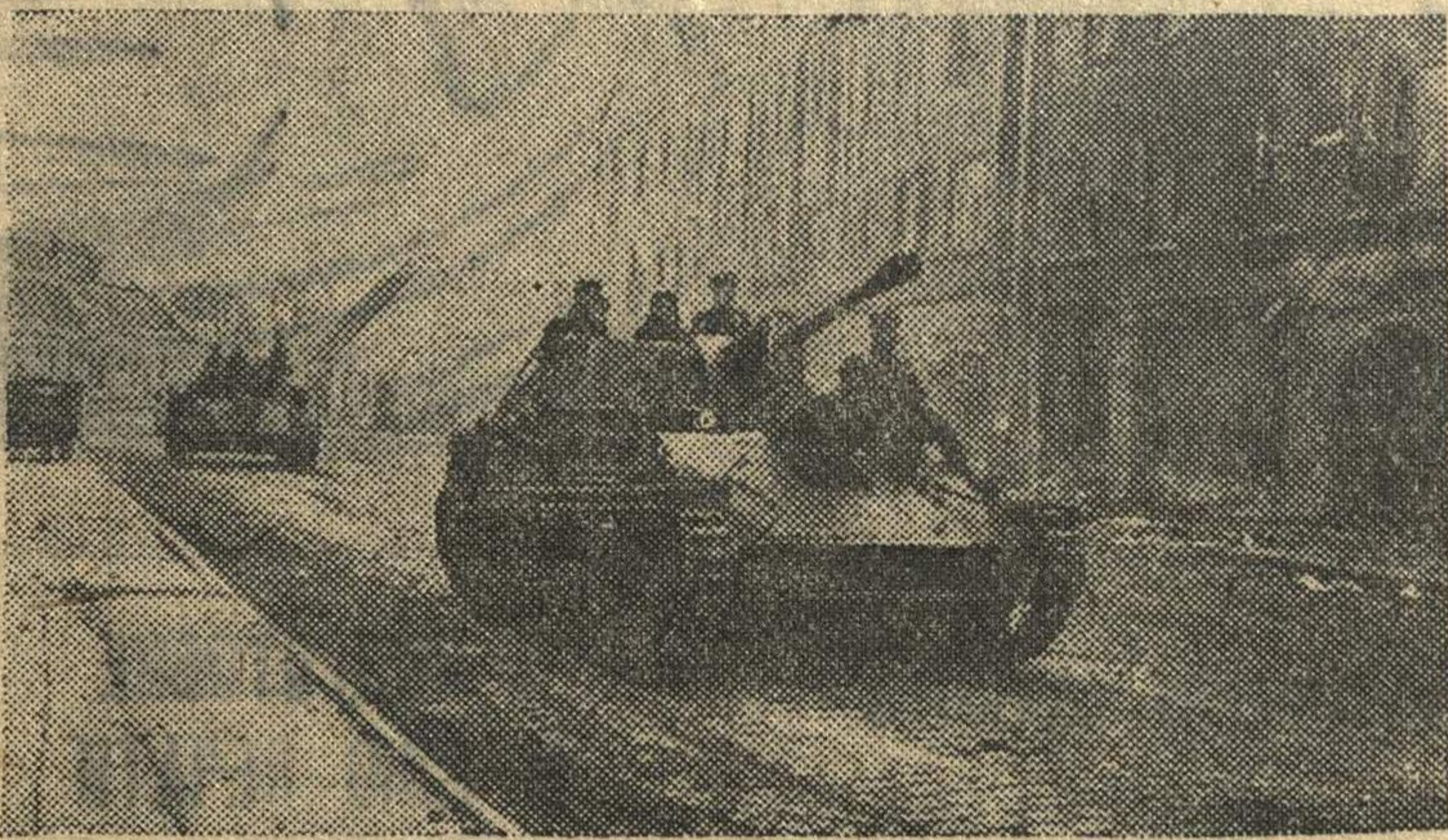
В городе Нойштеттин, занятом частями Красной Армии.