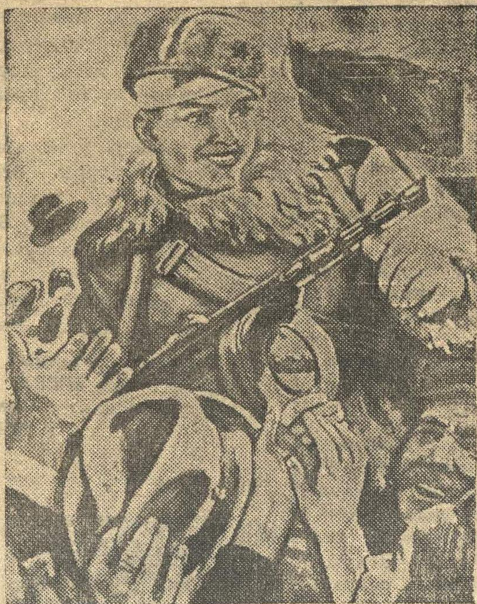
ОСВОБОДИТЕЛЮ — СЛАВА!

Да здравствует всенародный праздник День 1 Мая 1945 года!